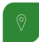
SUPERVISÃO DO BAB