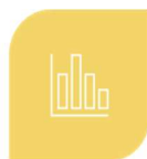
SUPERVISÃO DE OPERAÇÕES