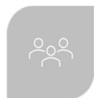
SUPERVISÃO DE PARTICIPANTES